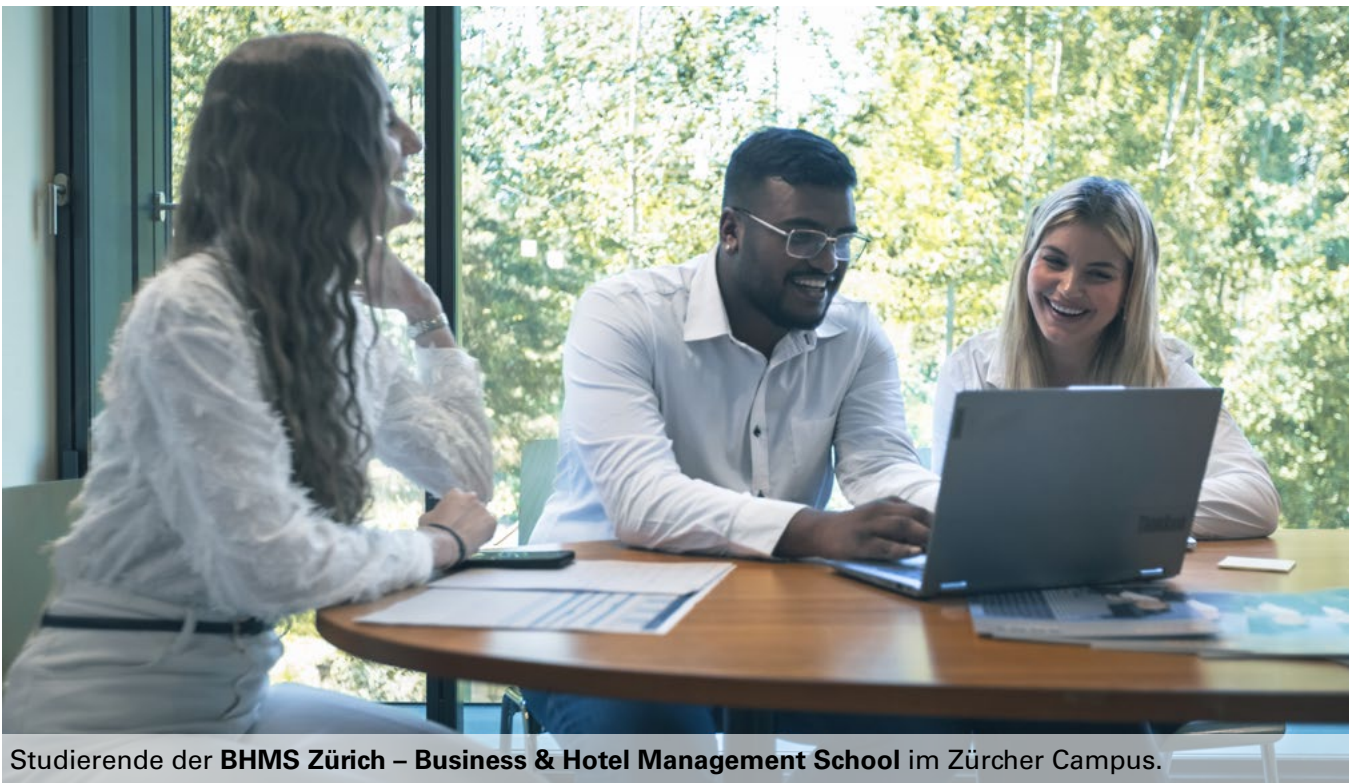
Studierende der BHMS Zürich – Business & Hotel Management School im Zürcher Campus.

Internationale Karrieren, steigende Nachfrage nach Fach- und Führungskräften und eine Branche im Wandel: Studiengänge im Hospitality- und Tourism Management eröffnen heute vielfältige Möglichkeiten – auch in der Schweiz.