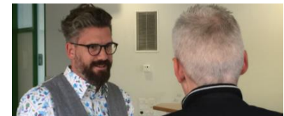
«Vorwand- und Einwandbehandlung»