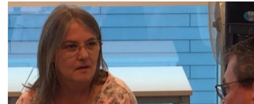
«Den nächsten Schritt aktiv verkaufen»