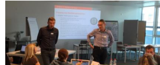
«No-Go: Haben Sie mein Angebot bekommen?»