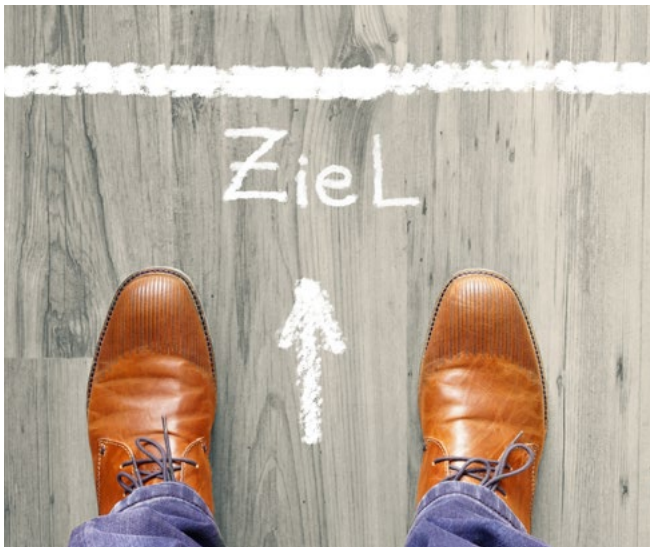
Wo möchte ich beruflich in drei bis fünf Jahren stehen?

www.ausbildung-weiterbildung.ch/laufbahnberatung-info.html