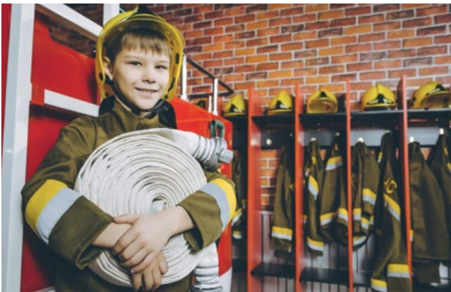
Was machen Sie leidenschaftlich gerne?

www.ausbildung-weiterbildung.ch/laufbahnberatung-info.html