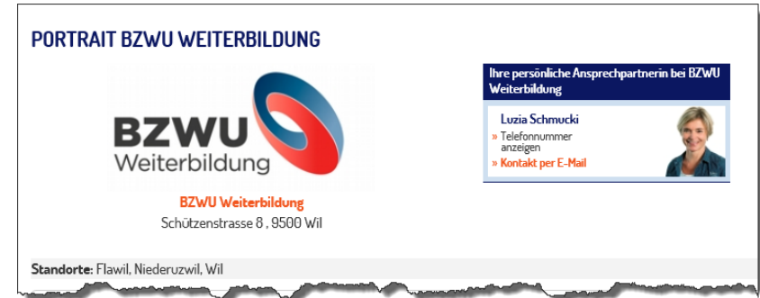
Beispiel persönliche Beraterbox im Porträt