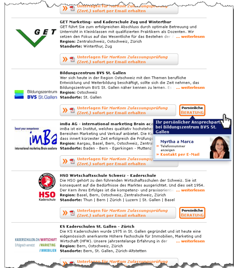
Beispiel Button «Persönliche Beratung» und Beraterbox in den Rubriken